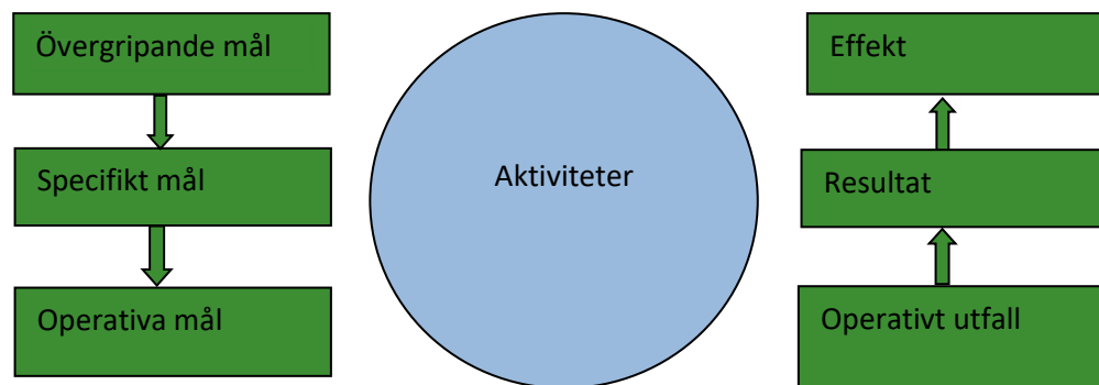
Figur 1. Interventionslogik som ska användas i utvärdering av nätverksaktiviteter.

Det kan vara svårt att identifiera hur en enskild nätverksaktivitet bidrar till programmets prioriteringar och mål. Vid utvärdering av nätverksaktiviteter kommer därför en så kallad interventionslogik att användas (Figur 1). Interventionslogiken ska även användas i Landsbyggsnätverkets planeringsarbete. Interventionslogiken beskriver en kedja där övergripande målen är önskat sluttillstånd av ett utfört arbete och effekter på lång sikt. De specifika målen mäts i de resultat som uppstår på kort sikt av utfört arbete. De operativa målen mäts i de presentationer som arbetet ger.