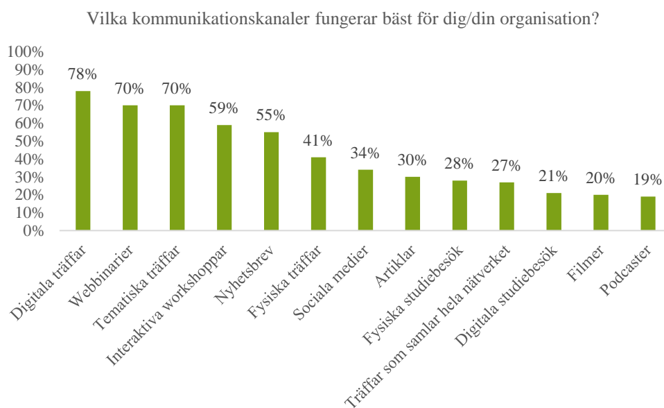
Figur 1: Landsbygdsnätverkets medlemmars svar på vilken kommunikationskanal som "fungerar bäst" för deras organisation