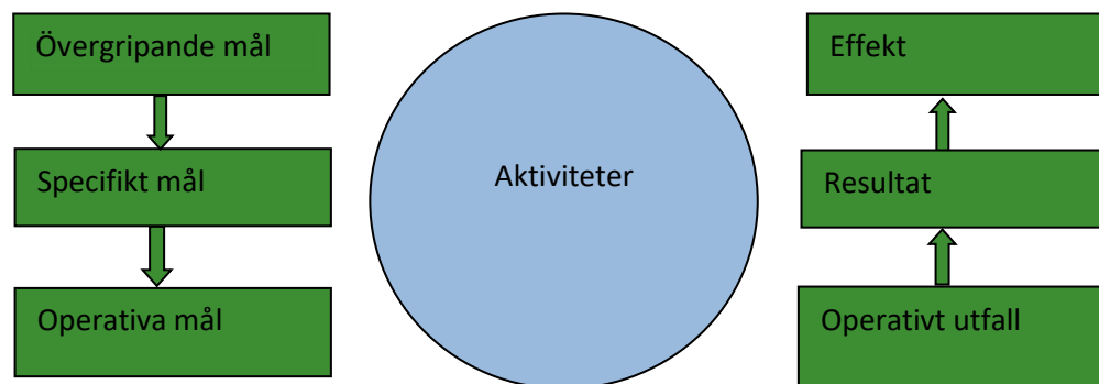
Figur 1. Interventionslogik som ska användas i utvärdering av nätverksaktiviteter.

Interventionslogiken beskriver en kedja där övergripande målen är önskat sluttillstånd av ett utfört arbete och effekter på lång sikt. De specifika målen mäts i de resultat som uppstår på kort sikt av utfört arbete. De operativa målen mäts i de presentationer som arbetet ger.