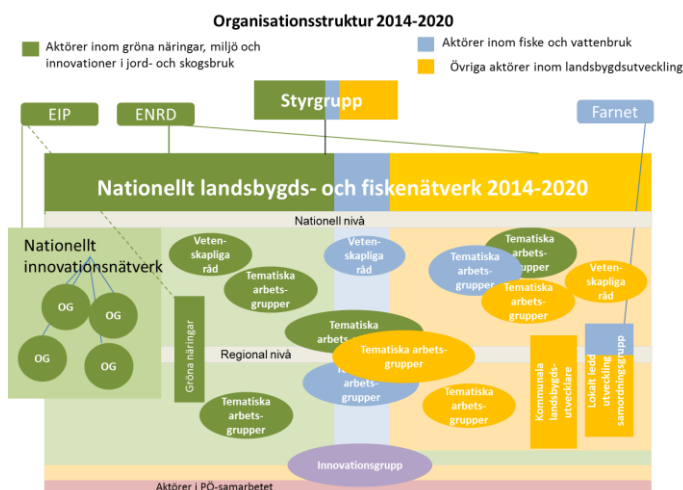
Figur 2 Organisationsstruktur för nationella nätverket för fiske-, vattenbruk och landsbygdsutveckling 2014-2020

”Landsbygdsutveckling” inklusive nätverksfunktioner erfarenhetsutbyte och samverkan mellan grupper för lokalt ledd utveckling inom både landsbygds- och fiskeområden.