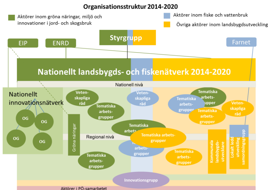
Figur 2 Organisationsstruktur för nationella nätverket för fiske-, vattenbruk och landsbygdsutveckling 2014-2020

”Landsbygdsutveckling” inklusive nätverksfunktioner erfarenhetsutbyte och samverkan mellan grupper för lokalt ledd utveckling inom både landsbygds- och fiskeområden.